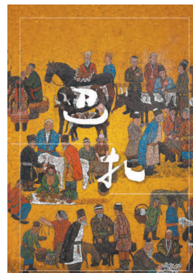
纪录片《巴扎》海报。

写了舅舅与拜依定大叔的深厚情谊。天山雪松根连根,各族人民心连心。巴扎不仅仅是牛羊、乐器、服装等商品交易场所,更是新疆生活的生动一角。正因为新疆各族儿女像石榴籽一样紧紧抱在一起,巴扎里的烟火气才能飘出新疆,让人流连忘返。民族团结之花也因巴扎绽放得更加多姿多彩。