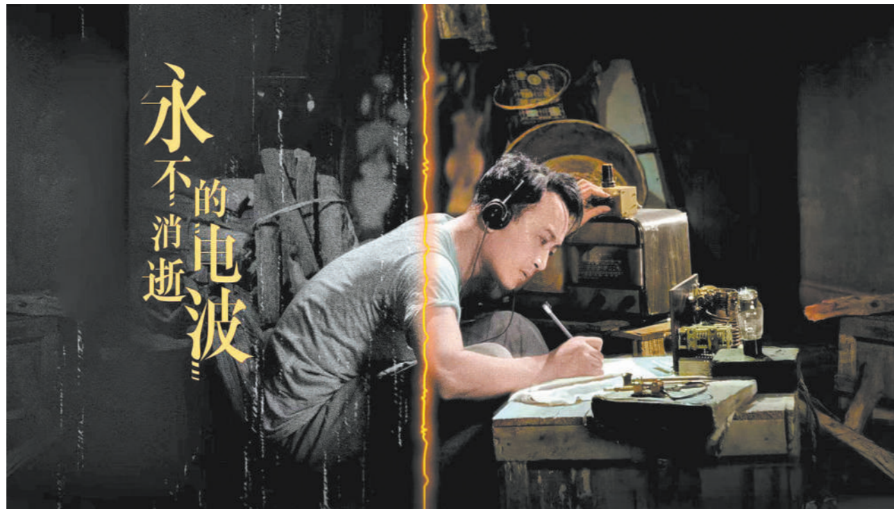
经过修复的电影《永不消逝的电波》剧照。

艺术修复是针对数字修复后的影像所采取的色阶还原手段。经过数字修复的影像,与原始影像存在感官差异。为了准确表达主创的创作理念,生动还原影像的本来面目,中国电影资料馆提出了“艺术修复”这一概念,遵循“修旧如旧,尊重原创”原则,努力提升艺术修复的水准。他们邀请影片主创人员指导,或查阅历史资料等相关信