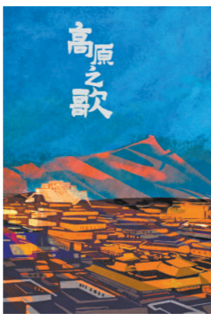
纪录片《高原之歌》海报。节目组提供