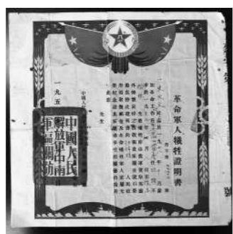
当年的烈士牺牲证明书。