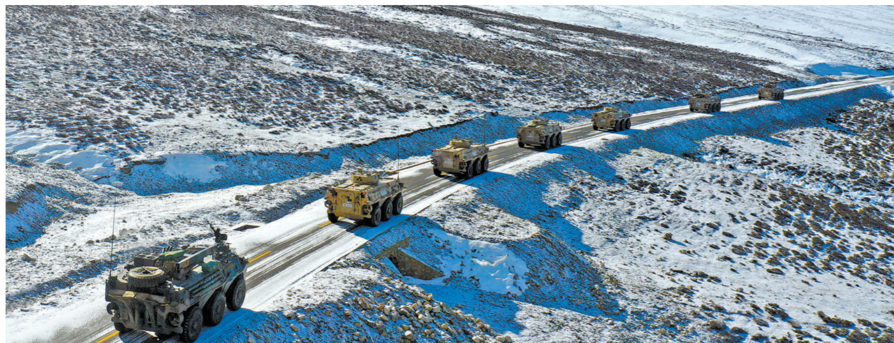
日前，陆军某部组织战车机动训练。