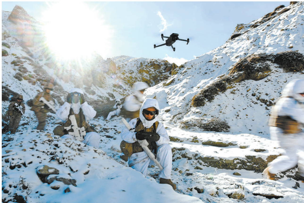
近日,陆军某旅组织侦察分队综合演训,锤炼官兵作战能力。图为分队前出侦察。

“亲情力量激发了学员成长成才内在动力,争先进、当先锋的氛围更加浓厚。”该校领导介绍说,学员们学习生活中自我要求严格,主动结合实际情况制订阶段性目标计划,综合考评优秀率不断提升。一批学员通过相关专业资质认证,多次在全国全军大学生学科竞赛中取得优异成绩。