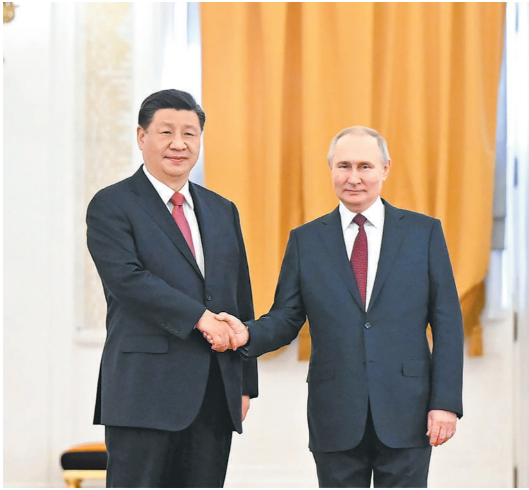
当地时间3月21日下午,国家主席习近平在莫斯科克里姆林宫同俄罗斯总统普京举行会谈。普京在乔治大厅为习近平举行隆重欢迎仪式。这是两国元首紧紧握手,合影留念。

新华社莫斯科3月21日电 (记者倪四义、范伟国)当地时间3月21日下午,国家主席习近平在莫斯科克里姆林宫同俄罗斯总统普京举行会谈。两国元首就中俄关系及共同关心的重大国际和地区问题进行了真挚友好、富有成果的会谈,达成许多新的重要共识。双方一致同意,本着睦邻友好、合作共赢原则推进各领域交往合作,深化新时代全面战略协作伙伴关系。