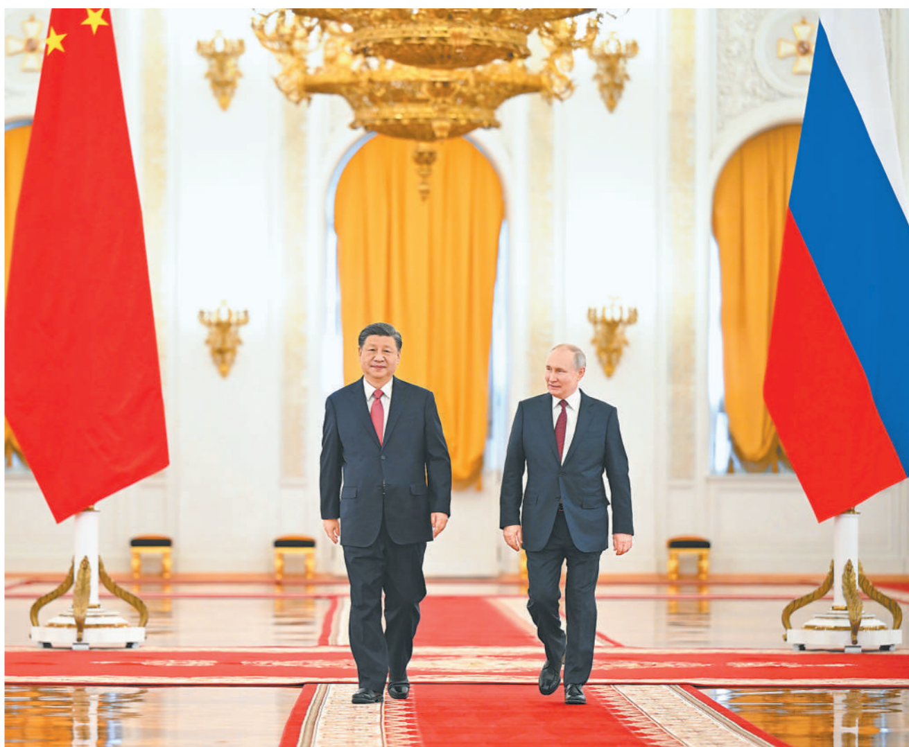
当地时间3月21日下午,国家主席习近平在莫斯科克里姆林宫同俄罗斯总统普京举行会谈。这是普京在乔治大厅为习近平举行隆重欢迎仪式。

两国元首还共同会见了记者。当晚,普京在克里姆林宫为习近平举行了隆重欢迎宴会。蔡奇、王毅、秦刚,以及俄罗斯联邦政府领导人出席上述活动。