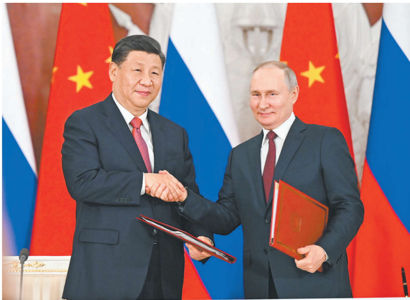
当地时间3月21日下午,国家主席习近平在莫斯科克里姆林宫同俄罗斯总统普京举行会谈。这是会谈后,两国元首共同签署《中华人民共和国和俄罗斯联邦关于深化新时代全面战略协作伙伴关系的联合声明》和《中华人民共和国主席和俄罗斯联邦总统关于2030年前中俄经济合作重点方向发展规划的联合声明》。