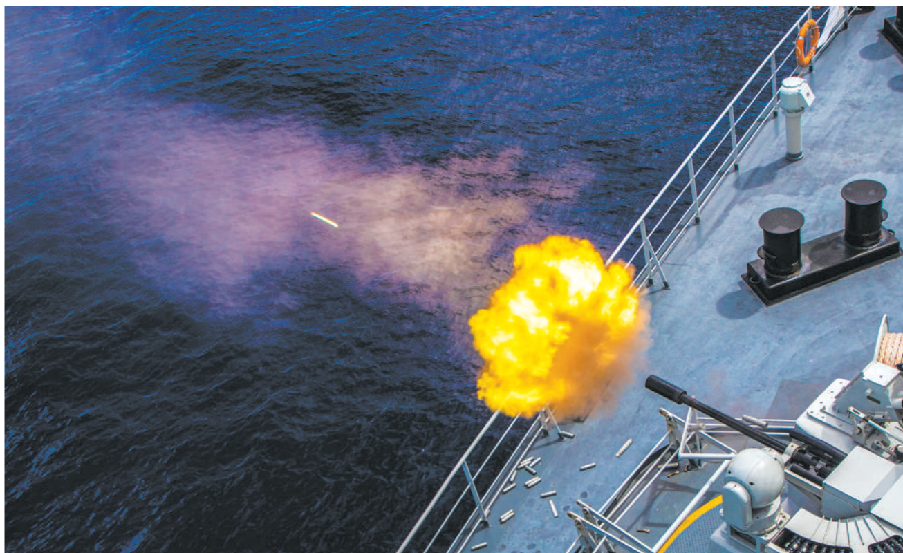
近日，南部战区海军某支队在远海开展实战化训练，提升官兵遂行多样化军事任务能力。

采访中，官兵们特别提到一个问题，那就是如何发掘和利用《连队要事日记》的价值，更好地为抓建基层所用。在此，把这个问题抛出来，希望广大战友也来帮他们出出主意。