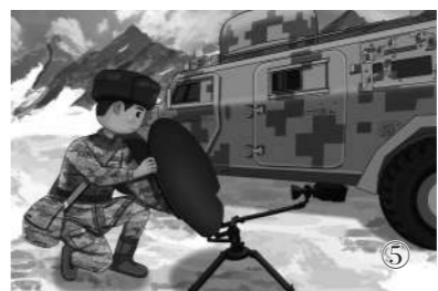
专业技能，我也迎头赶上。精武强能才能成为“昆仑尖兵”。