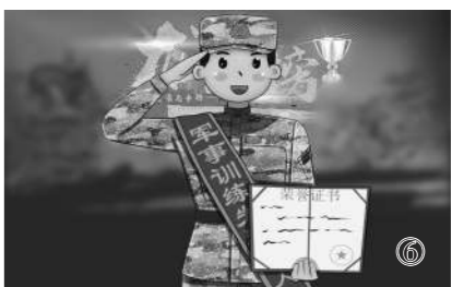
经过不懈努力，我被评为“军事训练先进个人”。