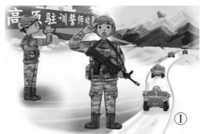
高原驻训誓师动员大会吹响了他们冲锋的号角。