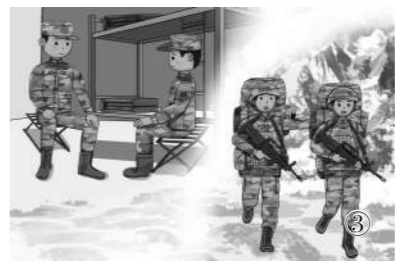
在班长和战友们的耐心帮助下，我重拾信心。