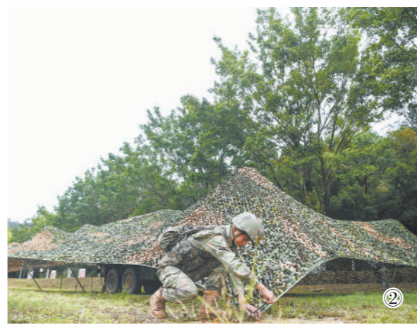
图②:远程火箭炮营炮班依托有利地形开展构筑伪装。