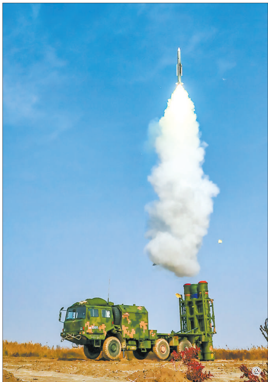
图①:战场机动,快速占领阵地。 图②:导弹拦截空中目标。 图③:高炮分队夜间射击。 图④:暗夜条件下进行导弹吊装。

紧贴实战,专攻精练。现场指挥员介绍,此次演练临机设置多个特情,引导官兵在困局、难局中完善战法训法,有效锤炼了打仗本领。