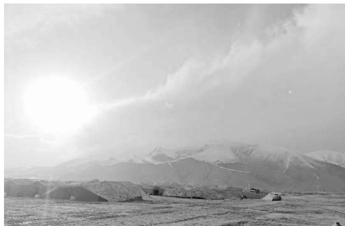
驻训地的冬日阳光。