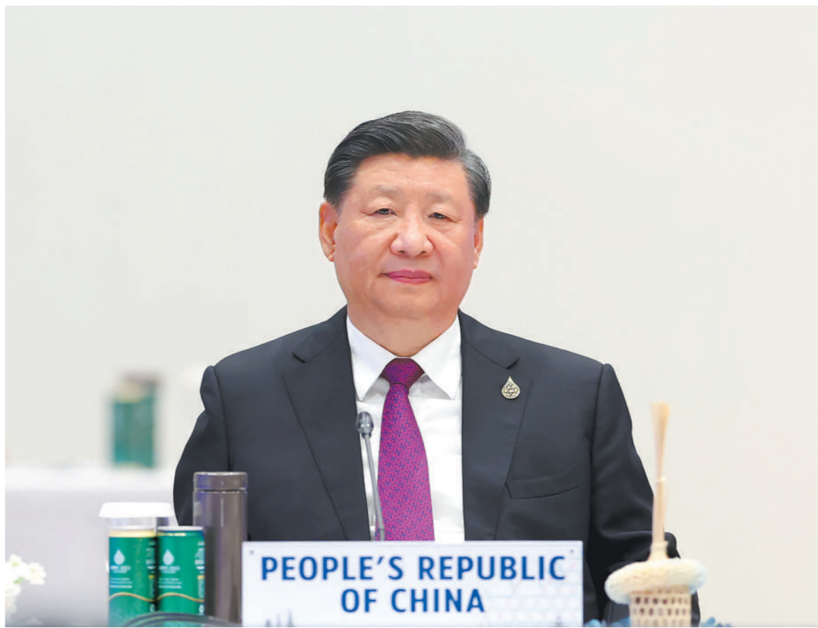
当地时间十一月十八日上午,亚太经合组织第二十九次领导人非正式会议在泰国曼谷国家会议中心举行。国家主席习近平出席会议并发表题为《团结合作 勇担责任 构建亚太命运共同体》的重要讲话。

●上个月,中国共产党第二十次全国代表大会成功举行,为当前和今后一个时期中国发展指明了方向、规划了蓝图。中国愿同所有国家在相互尊重、平等互利的基础上和平共处、共同发展。中国将坚持实施更大范围、更宽领域、更深层次对外开放,坚持走中国式现代化道路,建设更高水平开放型经济新体制,继续同世界特别是亚太分享中国发展的机遇