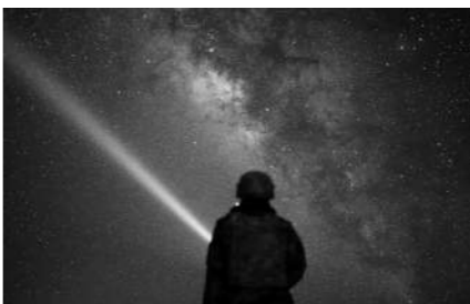
“哨所拍客”镜头中的星空。