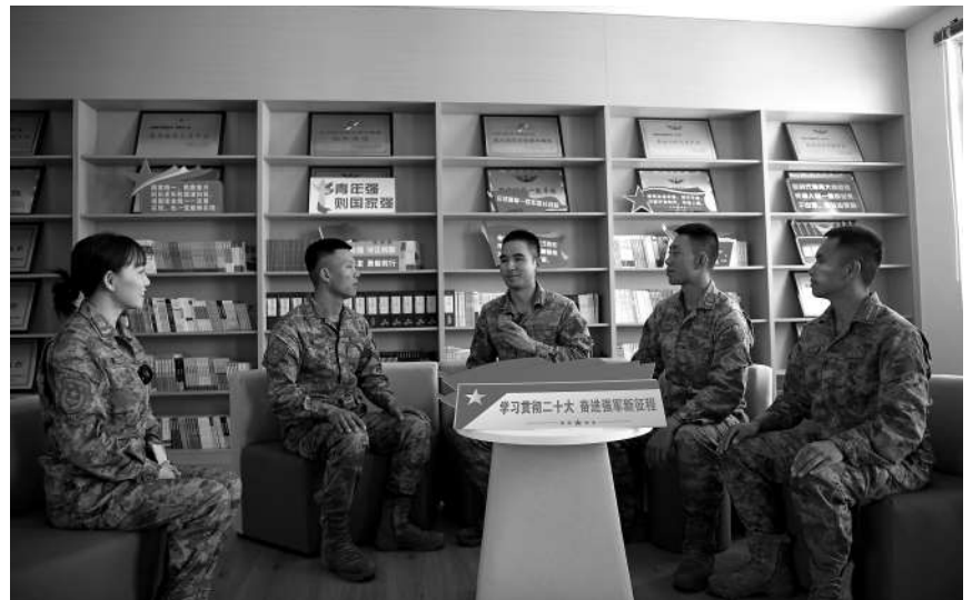
11月7日，陆军某旅理论骨干主持分组学习讨论，引导官兵加深对党的二十大精神的理解感悟。