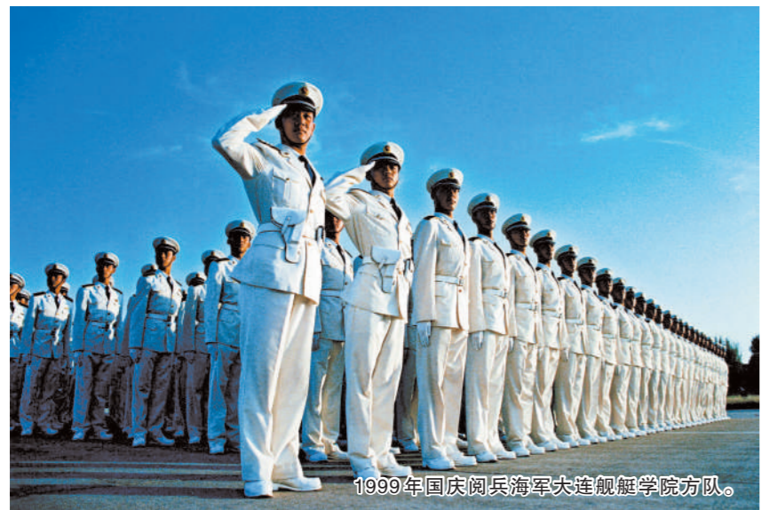
1999年国庆阅兵海军六连舰艇学院方队。

15次国庆阅兵，15次影像记录，新影不仅制作出了深受观众喜爱的纪录电影，而且为国家积累了宝贵的影像档案，这是历史赋予新闻纪录电影人的使命与机遇。