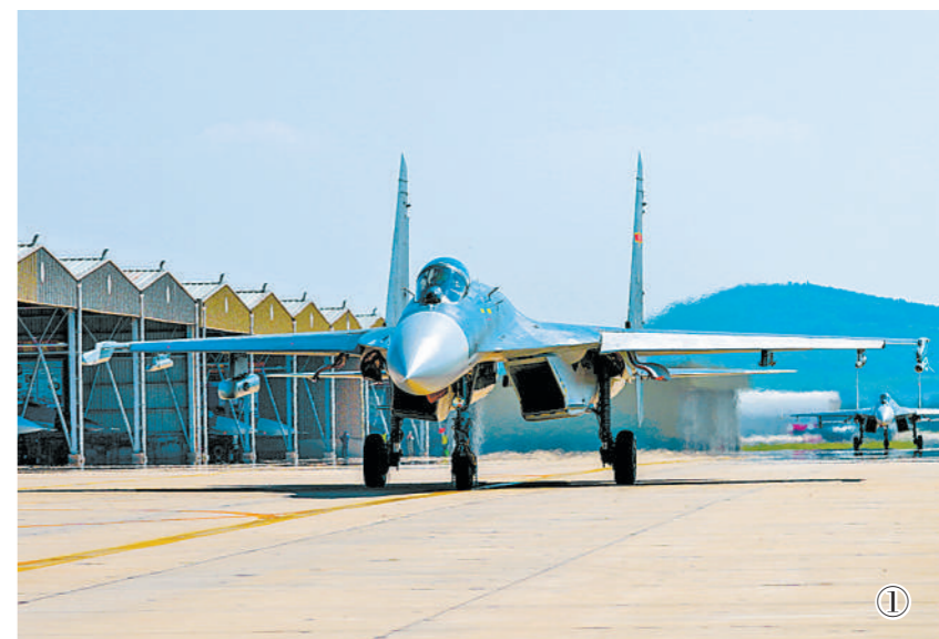
8月中旬，北部战区空军航空兵某旅展开新一轮实战实训，重点锤炼体系对抗能力。