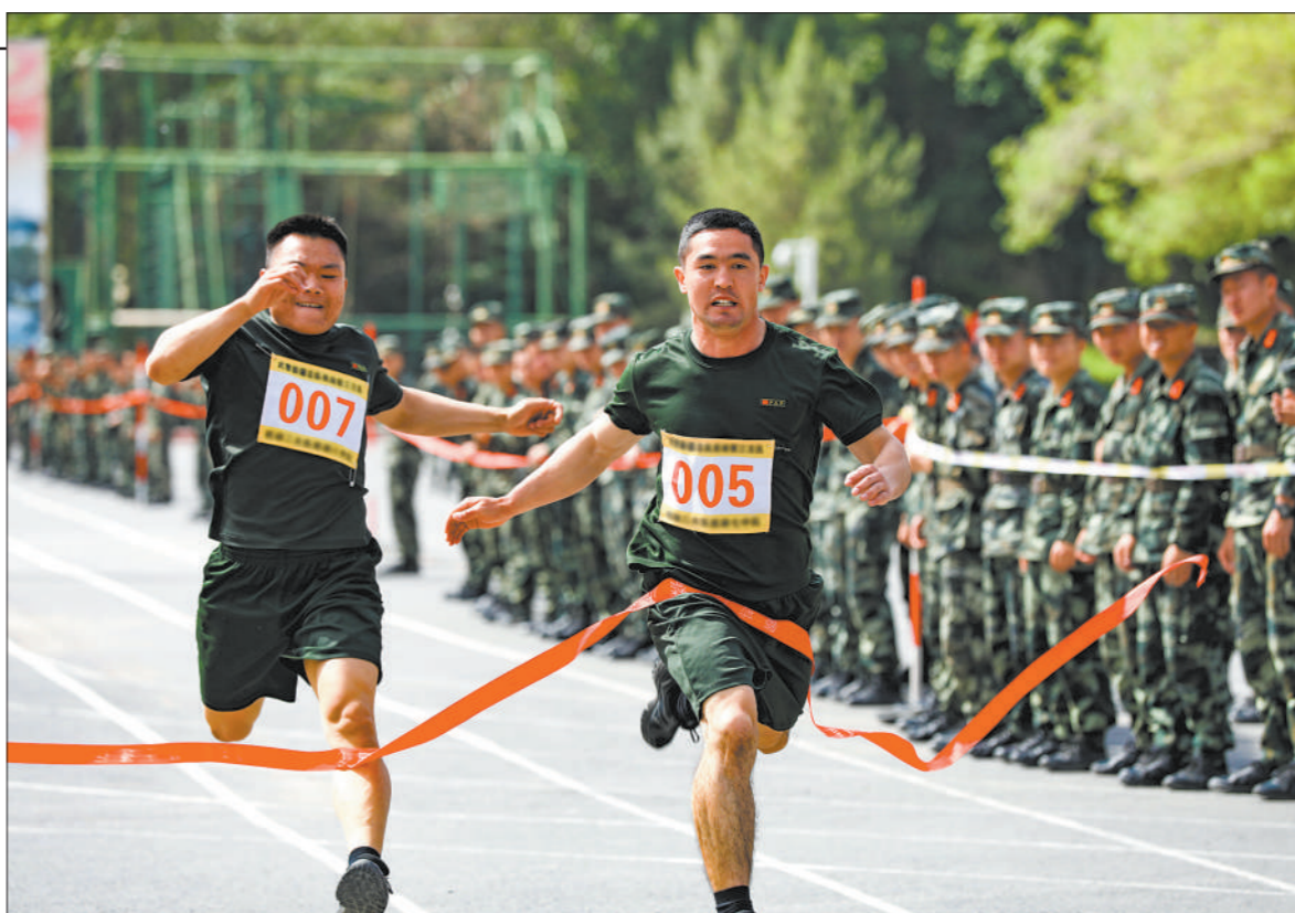
◇400米跑决赛中,参赛队员奋力冲刺。