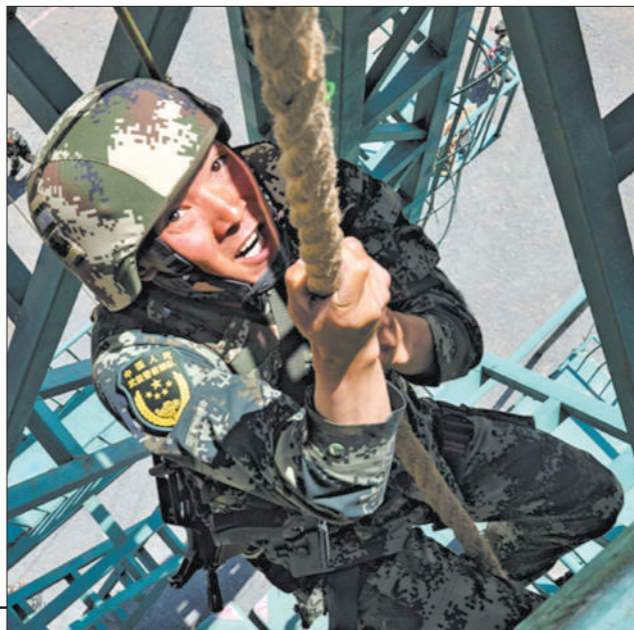
◇参赛队员在抓绳上项目中比拼。

体能比拼热火朝天,技能较量各显身手……近日,武警新疆总队某机动支队开展“利剑·2022”群众性比武竞赛。官兵们汇聚练兵场,上演一幕幕充满激情与胆气的角力争锋。