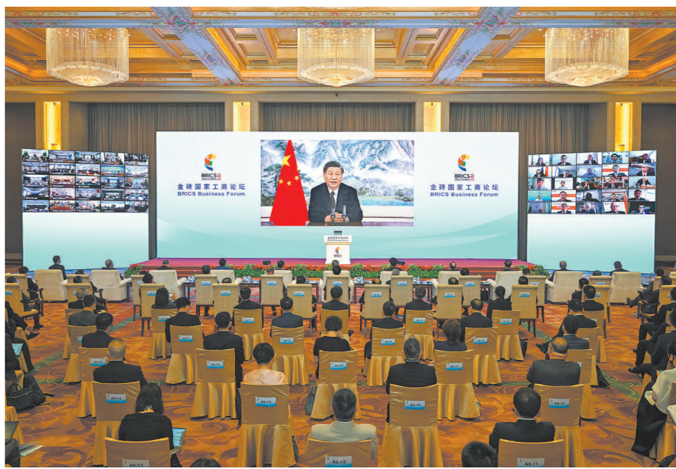
新华社北京6月22日电 6月22日晚,国家主席习近平以视频方式出席金砖国家工商论坛开幕式并发表题为《把握时代潮流 缔造光明未来》的主旨演讲。

习近平指出,当前,世界百年变局和世纪疫情相互交织,各种安全挑战层出不穷,世界经济复苏步履维艰,全球发展遭遇严重挫折。世界向何处去?和平还是战争?发展还是衰退?开放还是封闭?合作还是对抗?是摆在我们面前的时代之问。