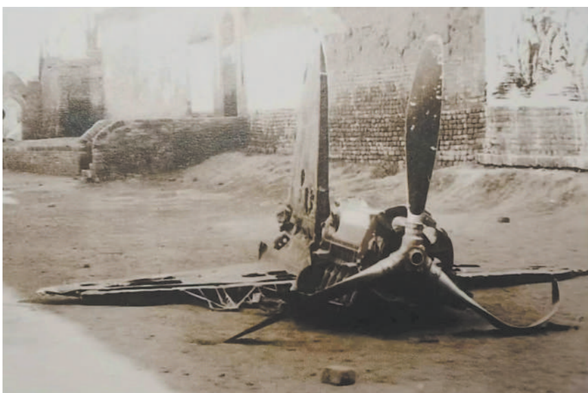
板桥集战斗中我军击落的日军飞机残骸。