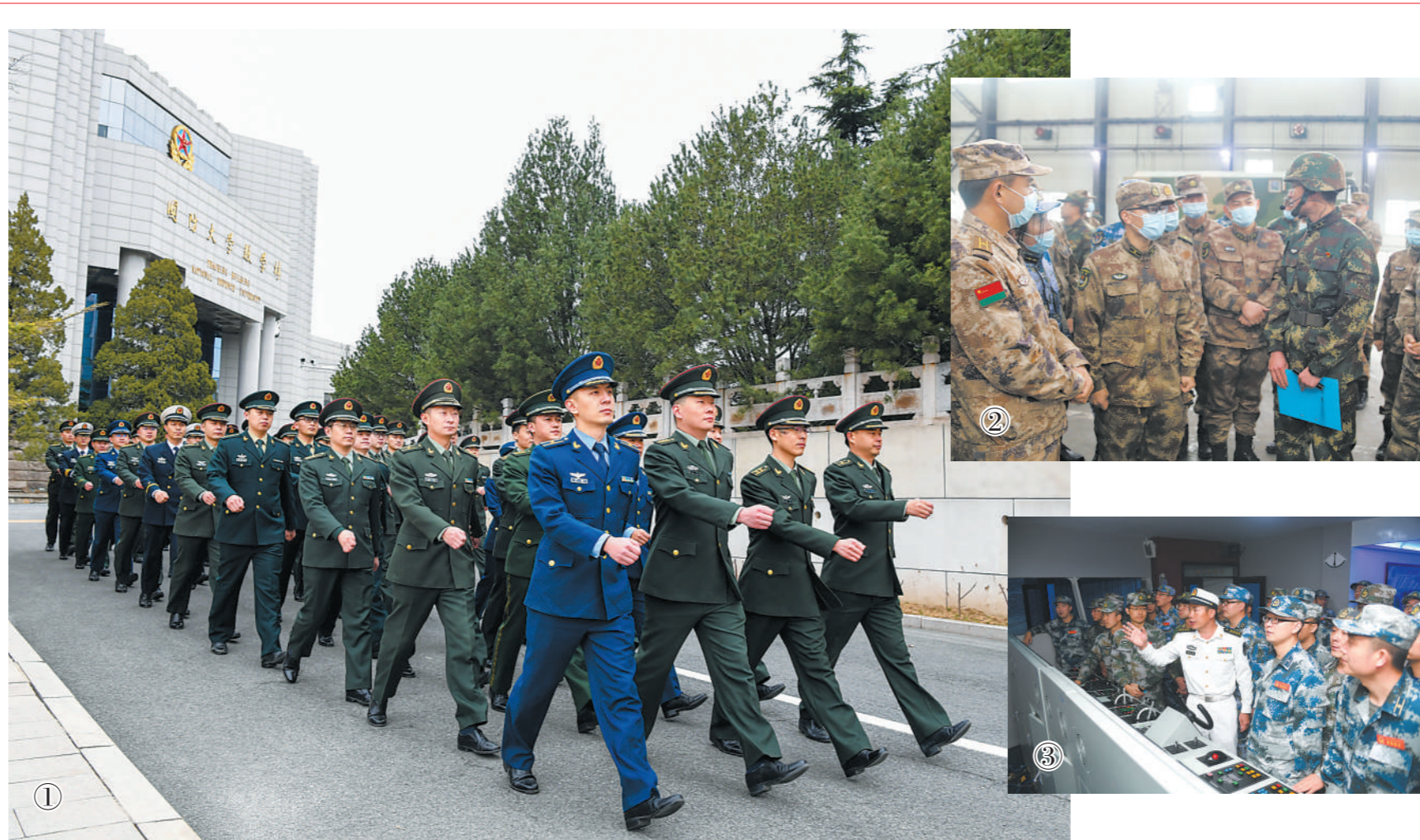
图①:国防大学研究生学员行进在校园里;图②③:国防大学学员赴军兵种部队参观见习。

青龙桥,一头连着中国军队最高学府,另外一头连着圆明园废墟。 在每一名国防大学学员眼中,这片断壁残垣就像历史的警钟。 “我们面临的下一场战争在哪里?又将以什么样的方式打响?”跨过青龙桥的一批批指挥员时常带着忧思。