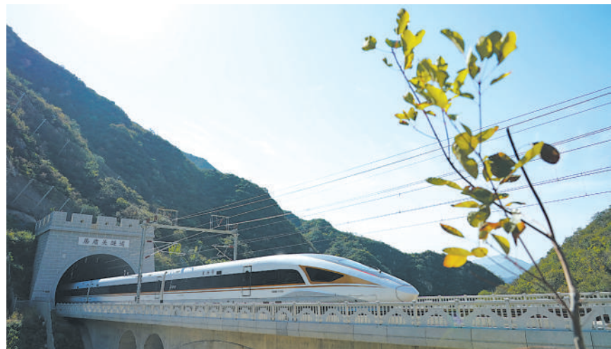
复兴号高铁驶过京张高铁居庸关隧道。

京坚定不移疏解非首都功能，发布全国第一个为治理大城市病制定的新增产业禁限目录并3次修订，2014年实施以来不予办理新设立或变更登记业务累计近2.4万件。