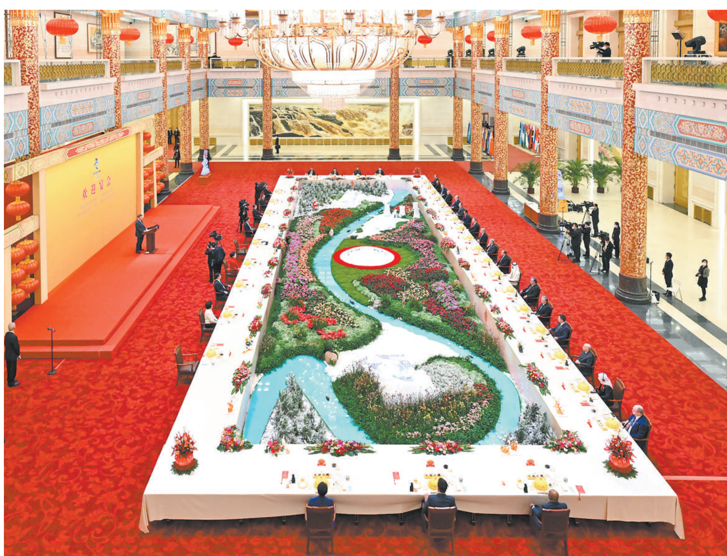
2月5日中午，国家主席习近平和夫人彭丽媛在北京人民大会堂金色大厅举行宴会，欢迎出席北京2022年冬奥会开幕式的国际贵宾。