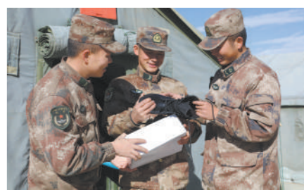
战士们驻训地收到被装。