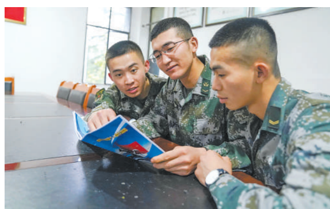
某部战士阅读被装精确申领流程。