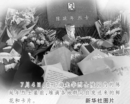
7月4日,在上海龙华烈士陵园内的陈延年烈士墓前,堆满各地群众自发送来的鲜花和卡片。