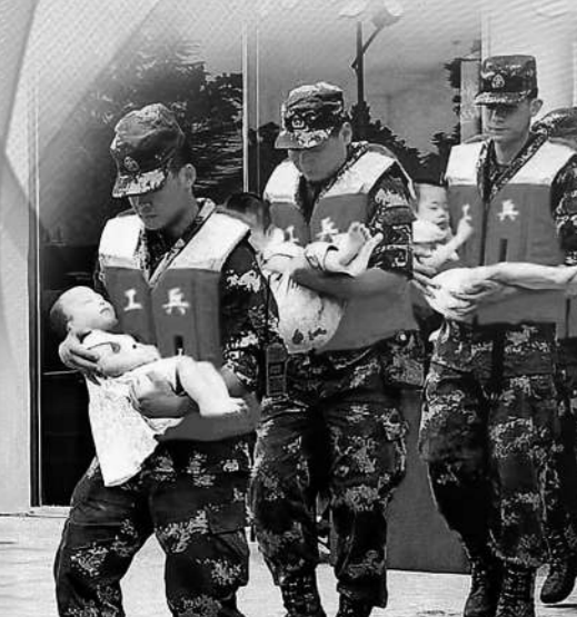
7月21日,火箭军驻豫某部官兵参加应急救援任务。