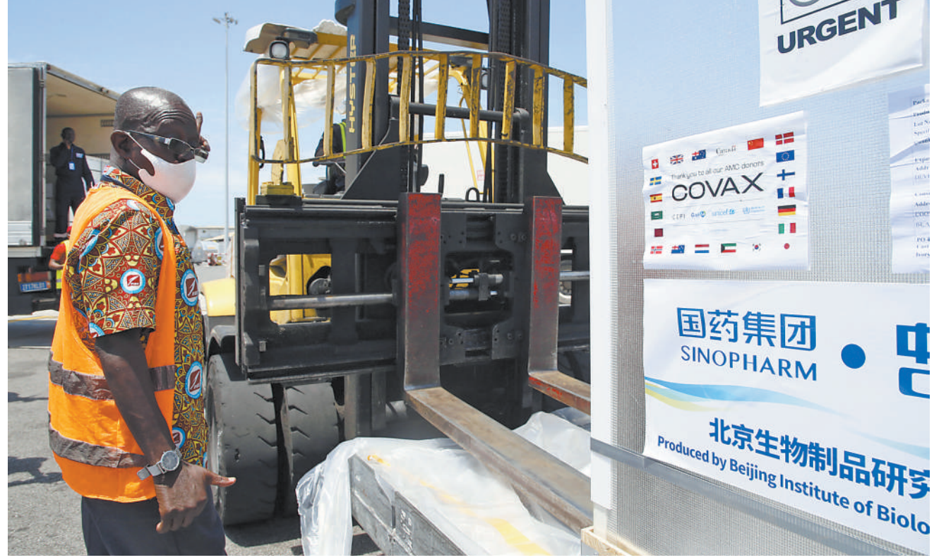
截至12月初,中国已向120多个国家和国际组织提供超过18.5亿剂疫苗,今年全年将对外提供20亿剂,并向“新冠疫苗实施计划”捐赠1亿美元。图为在科特迪瓦阿比让国际机场,工作人员搬运中国国药集团通过“新冠疫苗实施计划”供应科特迪瓦的新冠疫苗。

新华社北京12月21日电 (记者成欣、马卓言)针对美方依据美国内法,借口所谓“新疆人权”问题,对中方官员进行非法制裁,外交部发言人赵立坚21日说,有关行径严重干涉中国内政,严重违反国际关系基本准则,严重损害中美关系,中方对此坚决反对,强烈谴责,决定依法进行对等反制。 赵立坚在当日例行记者会上回答有关提问时说,针对美方上述错误行径,中方决定依据反外国制裁法进行对等反制,自即日起对美国国际宗教自由委员会主席马恩扎、副主席特克尔、委员巴尔加娃、委员卡尔实施相应反制。措施包括禁止上述人员入境中国(包括内地和香港、澳门),冻结其在华财产,禁止中国公民和机构同其交易。 “必须指出,新疆事务纯属中国内政,美方没有权利、没有资格横加干涉。美方应撤销所谓制裁,停止干涉新疆事务和中国内政。中方将视形势发展作出进一步反应。”赵立坚说。