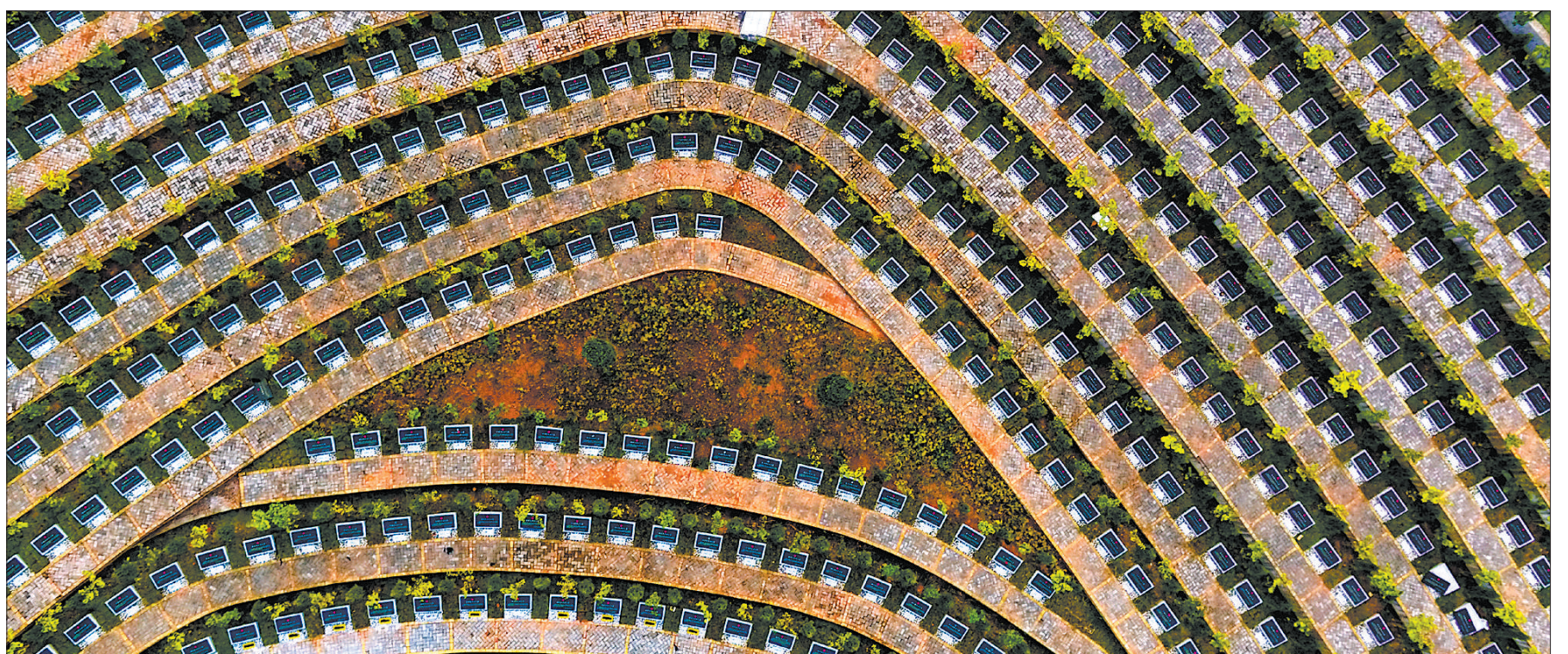
长征的胜利,是无数红军将士用鲜血和生命换来的。图为江西省兴国县高兴镇腊石寨中央苏区烈士陵园烈士墓碑群。