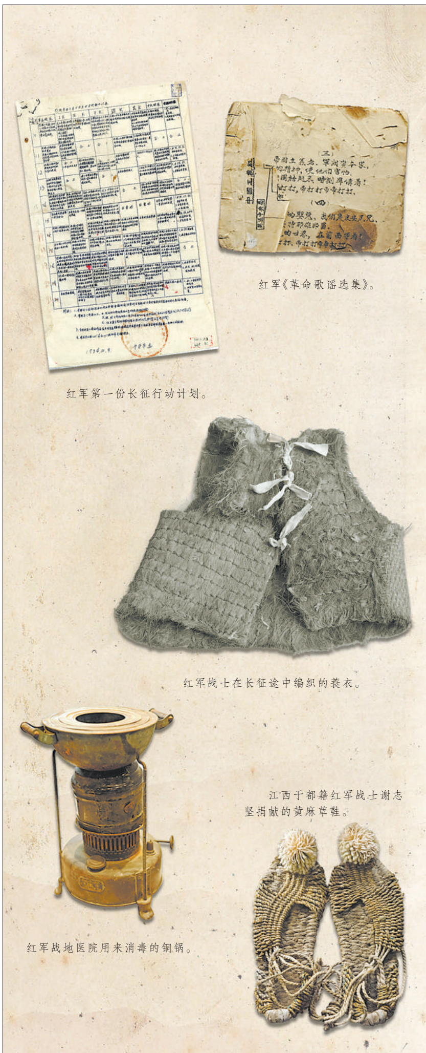
红军《革命歌谣选集》。