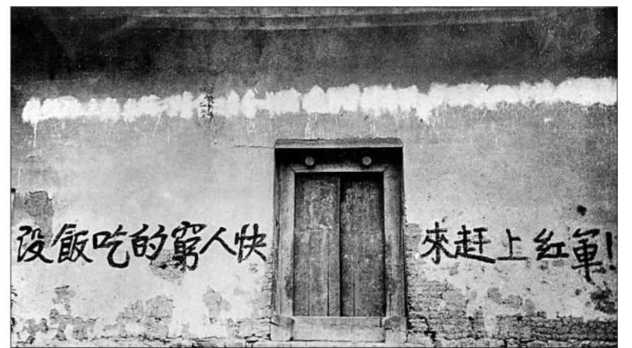
红二十五军在湖北省鄂西地区书写的标语。