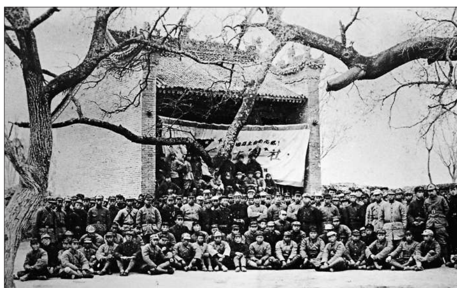
1936年,到达陕北的红一、二、四方面军团以上干部合影。