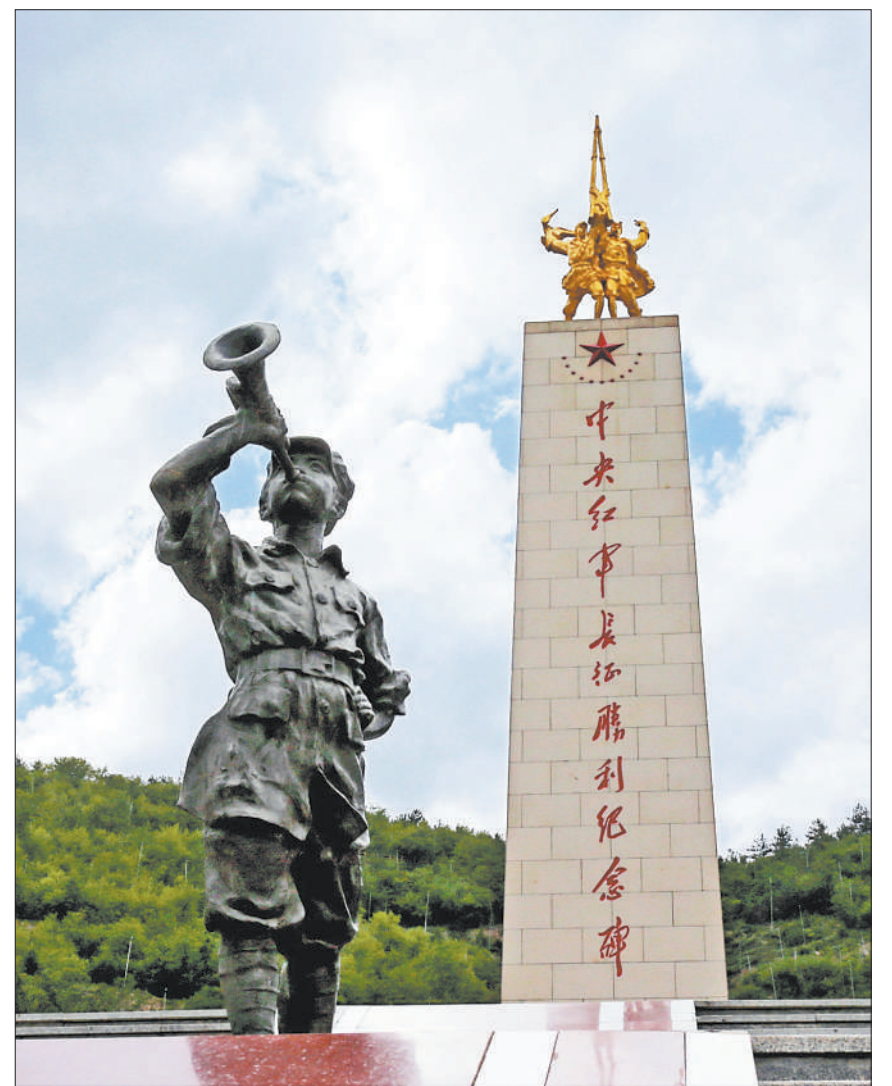
陕西省吴起县中央红军长征胜利纪念馆内,红军小号手吹响冲锋号的雕像令人热血沸腾。