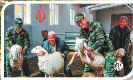
图①：河北省阜平县骆驼湾村新貌。图②：湖南省花垣县十八洞村刻有“精准扶贫”的石头。