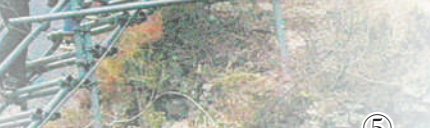
图③：贵州省从江县人武部组织民兵帮助群众抢收水稻。 图④：武警甘肃总队官兵为村民发放母羊。 图⑤：四川省昭觉县阿土列尔村村民攀爬梯子上山。