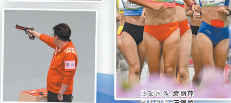
版面统筹：袁丽萍 刊头书法：汪德龙 版式设计：贾国梁、郭子涵