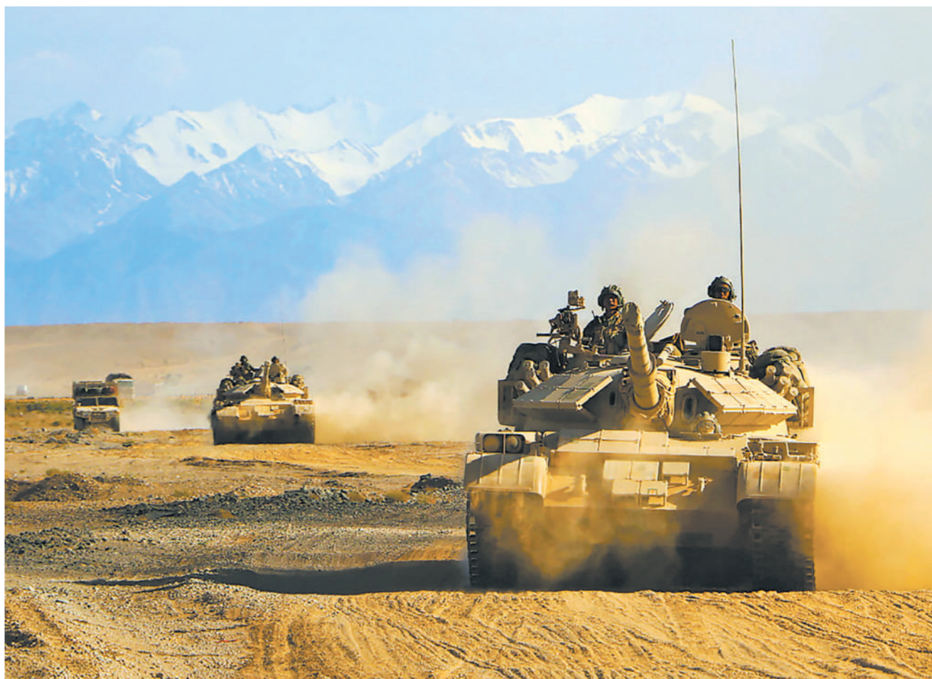
9月17日,第77集团军某旅在戈壁开展战场机动演练。