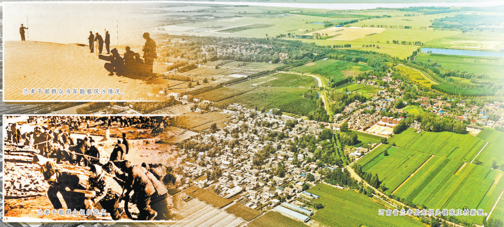
兰考干部群众当年勘察风沙情况。