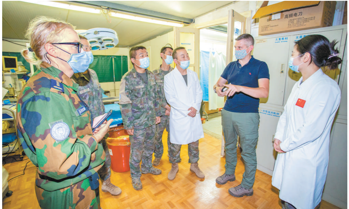
7月17日，联刚稳定团战略规划工作组来到中国二级医院，对我第24批赴刚果(金)维和医疗分队工作开展情况进行实地调研。工作组听取了该医疗分队的现场汇报，就患者处置、后勤保障等相关事项进行了深入探讨和交流。图为工作组与分队医疗人员进行交流手术室建设和工作开展情况。