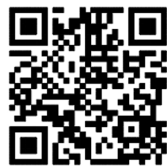
扫描二维码 更多视频请 空军军医大学公众号