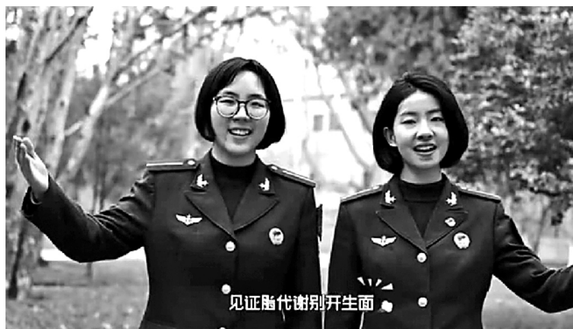
上图:学员在演唱。 视频截图