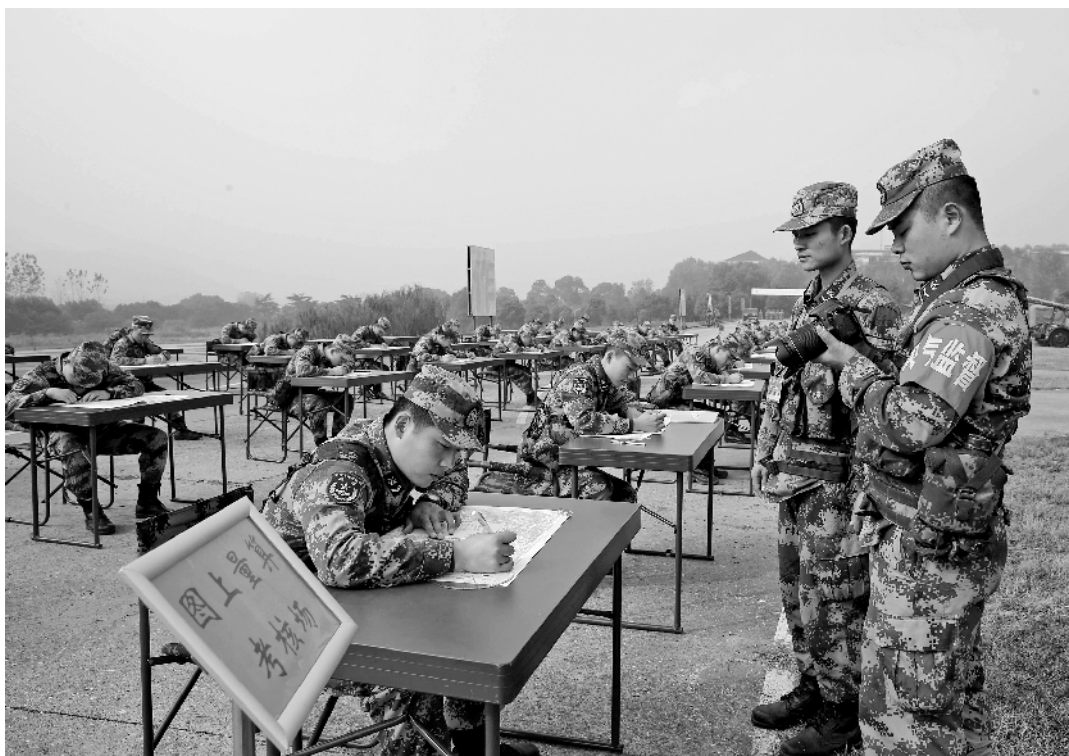
近日，第72集团军某旅组织年度军事训练综合考核。考核中，基层风气监督员全程参与，确保考核公平公正。