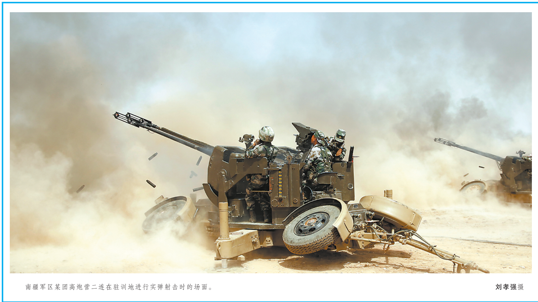
南疆军区某团高炮营二连在驻地进行实弹射击时的场面。