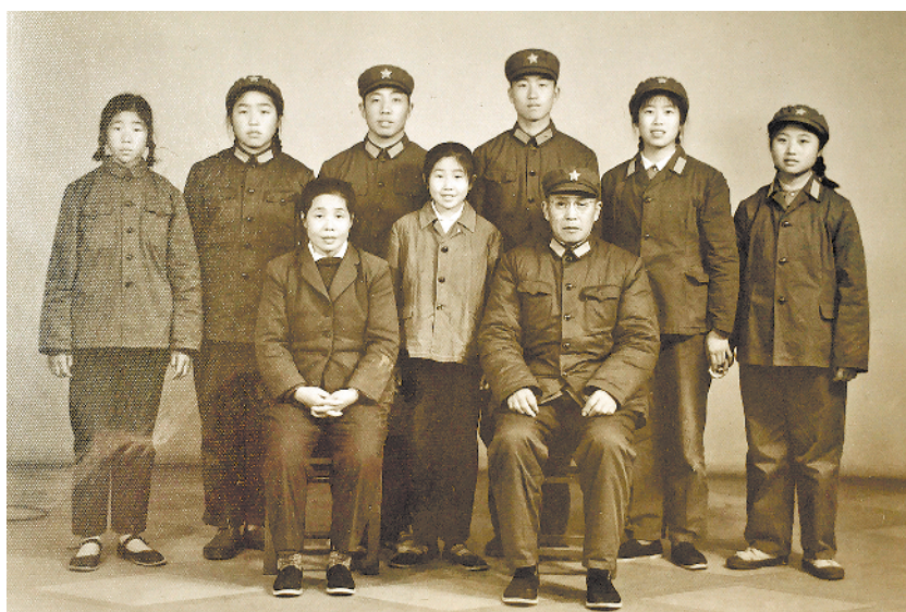
图为作者(前排中间的小女孩)的全家福,摄于1971年底。