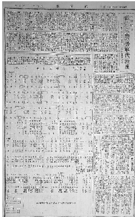
右图为1939年10月12日,《抗敌报》刊登学唱《新四军军歌》命令及歌谱。

意见,最后修改定稿。“政治部要我作曲。第一稿经文化队试唱,军部首长及文艺工作者认为不够雄壮。政治部主任袁国平说,如今是对日本侵略作战,我们的军歌要求雄壮有力,有把敌人赶出东海的气魄。我按此意见写了第二稿……”