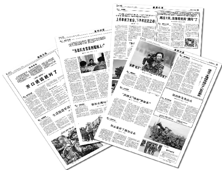
本版刊发过的张笑寒指导员周记。沈杰制图

台下的人津津有味地听着，原来“候”地一下过去的这一年，发生了这么多闪闪发光的事。