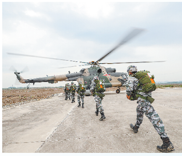
5月中旬，第72集团军某旅开展多伞型携装伞降训练。 上图：携装登机。 右图：伞花绽放。 下图：心理咨询师加油鼓劲。