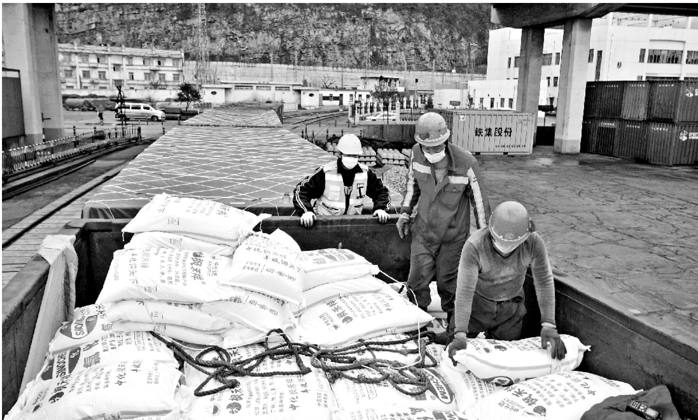
为助力春耕备耕,长三角铁路部门对接地方政府和春耕物资企业,按照“一企一策”制订运输方案,保证化肥等春耕生产物资优先挂运。图为2月28日,铁路江苏徐州货运中心连云港站作业人员在平整货物。