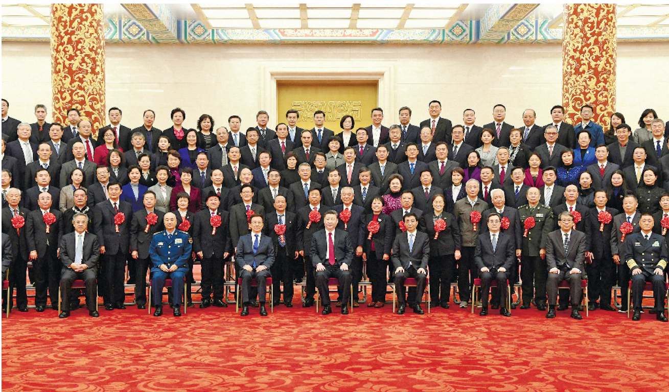
12月16日,党和国家领导人习近平、王沪宁、韩正等在北京人民大会堂会见全国离退休干部先进集体和先进个人代表。