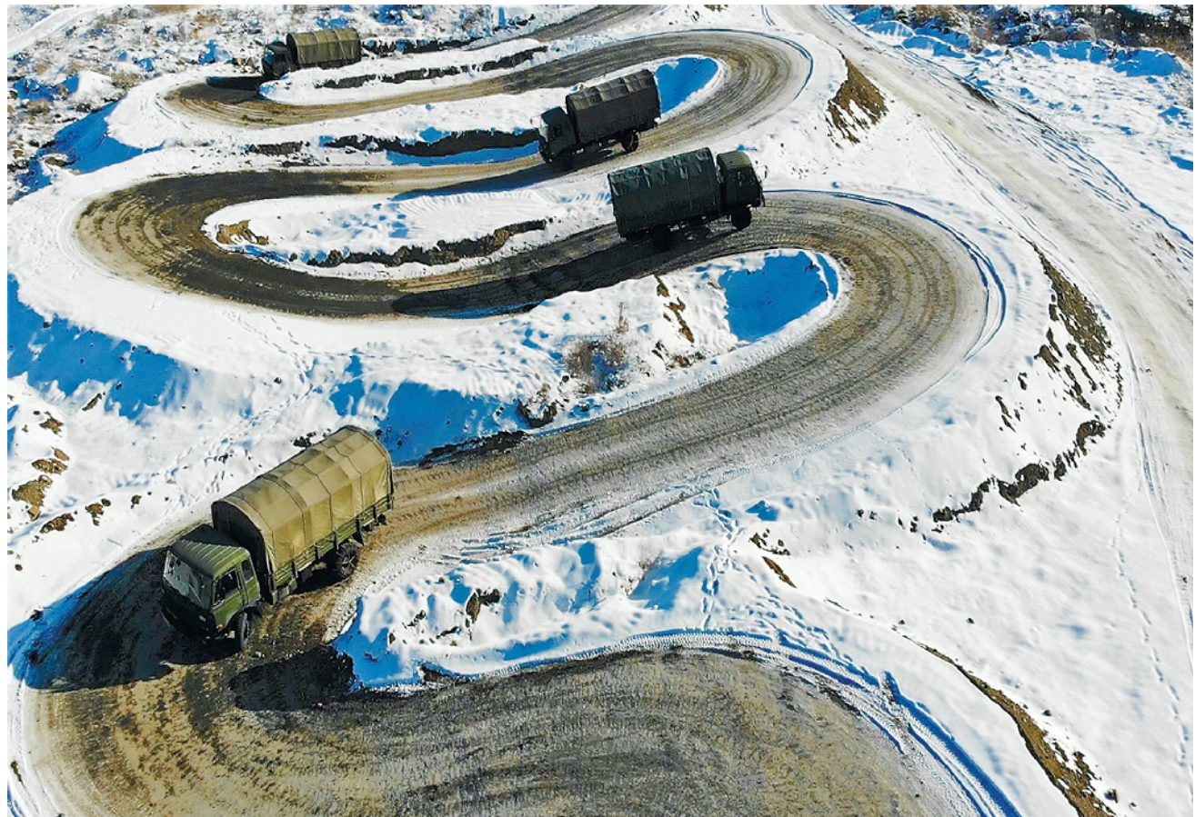
近日,新疆军区某团组织开展快速机动训练,提升部队遂行任务能力。