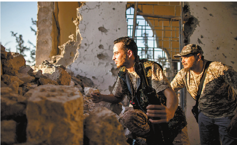
这是7月25日在利比亚的黎波里国际机场附近拍摄的支持利比亚民族团结政府的武装人员。利比亚民族团结政府20日说,东部军事领导人哈利法·哈夫塔尔麾下“国民军”可能加强对首都的黎波里的攻势。

印度方面于2015年9月与波音公司签订合同,为印度空军购买22架“阿帕奇”和15架“奇努克”直升机。