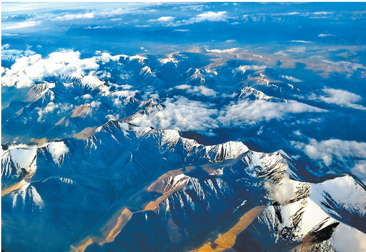
视觉阅读·雪山之巅

纪实文学《黄克诚在中央纪委》（人民出版社），记述的是黄克诚自1978年12月在党的十一届三中全会上担任中央纪委常务书记后，铁面无私抓党风、廉洁自律做表率的光辉历程。他在中央纪委工作的七年时间里，以高度的历史担当精神，在年高体弱、双目失明的情况下勇挑重担，坚持实事求是工作作风，为改革开放事业做出重大贡献。该书以生动细腻的描写展示了黄克诚敢讲真话、信念坚定、廉洁自律、有独立思考精神、有大局意识、有高贵政治品格的共产党人形象。该书史料丰富、内容充实、语言生动、情节感人，是一部集史料性与文学性、思想性与可读性于一体的纪实文学作品。