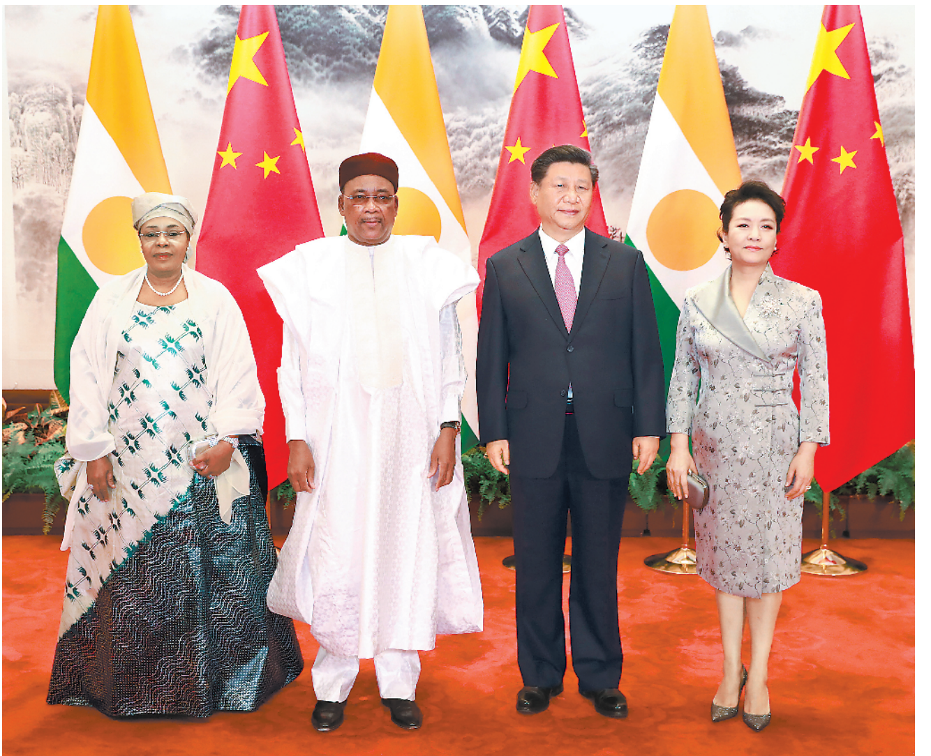
5月28日,国家主席习近平在北京人民大会堂同尼日尔总统伊素福举行会谈。这是习近平和夫人彭丽媛同伊素福夫妇合影。

新华社北京5月28日电 (记者郑明达)国家主席习近平28日在北京人民大会堂同尼日尔总统伊素福举行会谈。习近平赞赏伊素福长期致力于中尼、中非友好事业。习近平指出,中尼是好朋友、好伙伴、好兄弟。当前,中尼两国政治互信不断加强,各领域务实合作成果丰硕。中方愿同尼方一道努力,以落实中非合作论坛北京峰会成果为契机,加强战略合作,更好造福两国人民。习近平强调,中尼两国要继续在涉及彼此核心利益和重大关切问题上相互理解、相互信任、相互支持,积极开展治国理政和发展经验交流。中尼要在共建“一带一路”倡议和中非合作论坛框架内加强对接,落实好基础设施、民生、能源、农业领域重要合作项目。中方将继续支