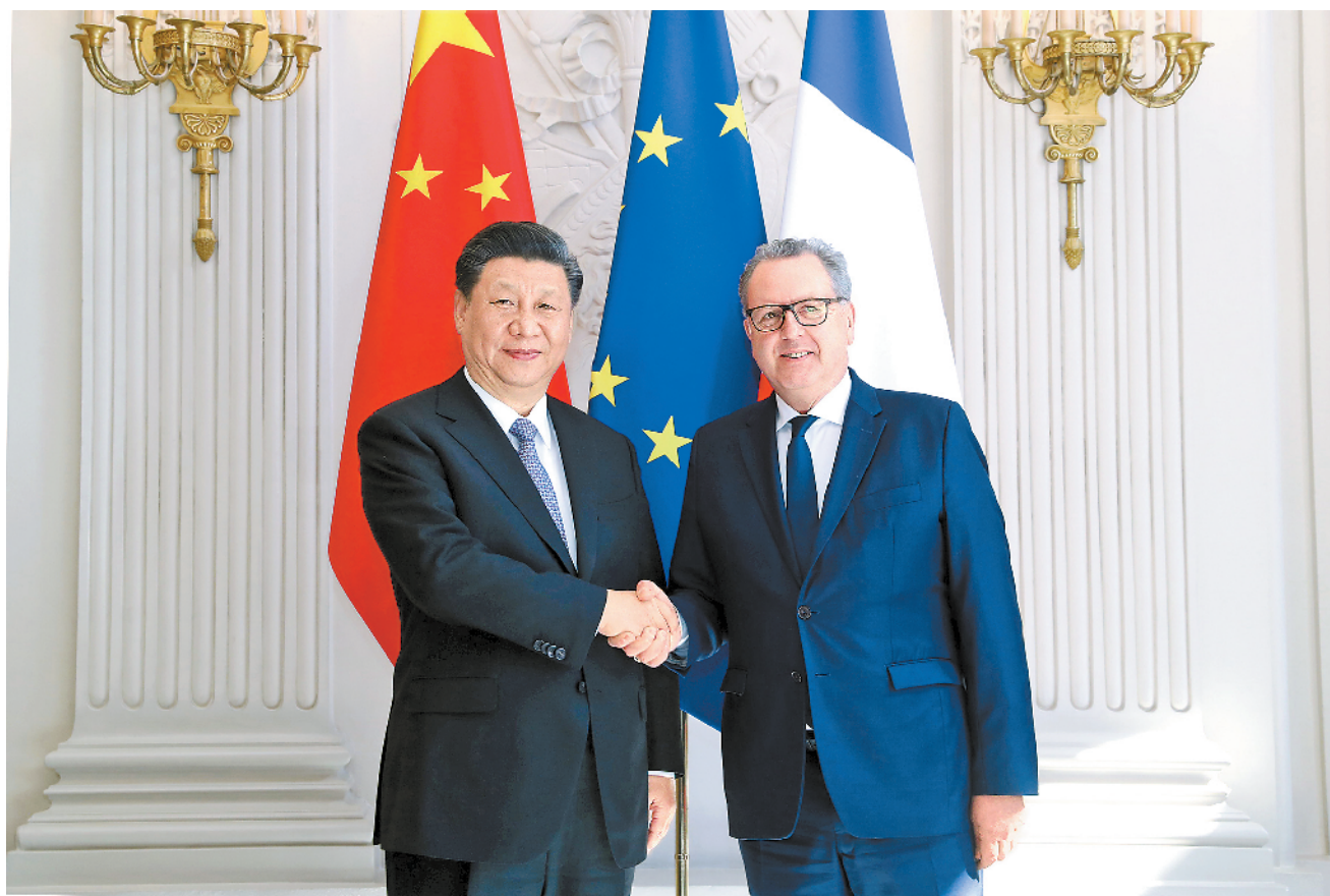
3月26日，国家主席习近平在巴黎会见法国国民议会议长费朗。