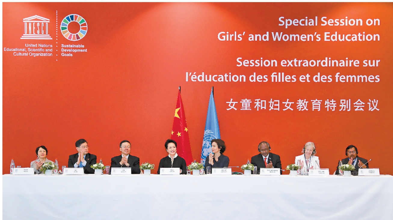
当地时间3月26日，国家主席习近平夫人、联合国教科文组织促进女童和妇女教育特使彭丽媛应联合国教科文组织邀请，出席在该组织巴黎总部举行的女童和妇女教育特别会议。