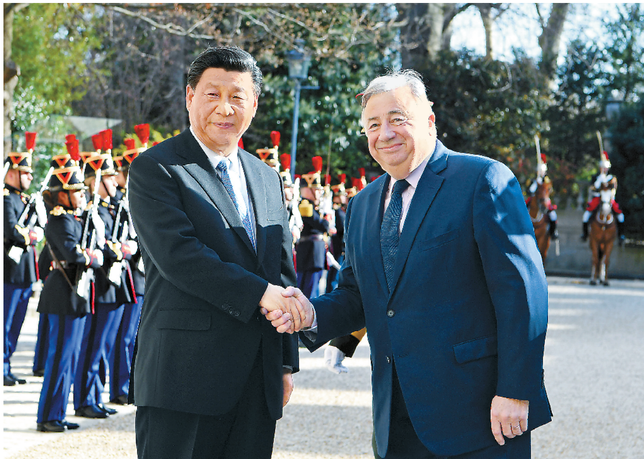
3月26日，国家主席习近平在巴黎会见法国参议长拉尔歇。