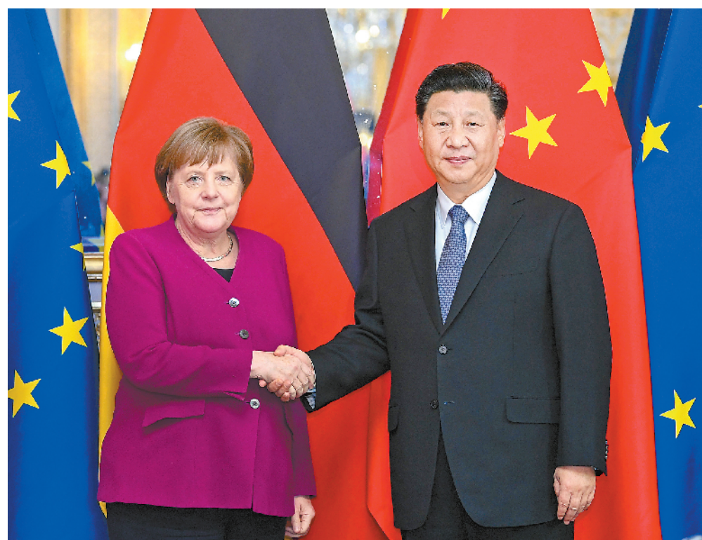
3月26日,国家主席习近平在巴黎会见专程前来出席中法全球治理论坛闭幕式的德国总理默克尔。