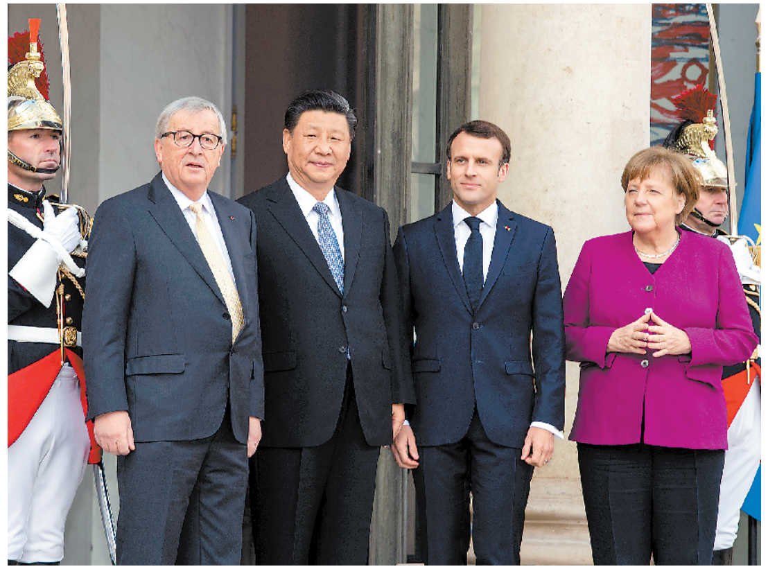
3月26日,国家主席习近平在巴黎同出席中法全球治理论坛闭幕式的法国总统马克龙、德国总理默克尔和欧盟委员会主席容克举行会晤。

● 面对百年未有之大变局,面对严峻的全球性挑战,面对人类发展在十字路口何去何从的抉择,各国应该积极做行动派、不做观望者,共同努力把人类前途命运掌握在自己手中。一要坚持公正合理,破解治理赤字;二要坚持互商互谅,破解信任赤字;三要坚持同舟共济,破解和平赤字;四要坚持互利共赢,破解发展赤字。