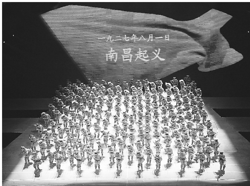
舞蹈《点燃朝霞》剧照。资料图片

军旅舞蹈动作主要体现军人的勇武之气和阳刚之美。它的动作特点是中、正、直、挺,这些特征塑造了军人坚贞不屈、顽强拼搏的形象。如果说中国