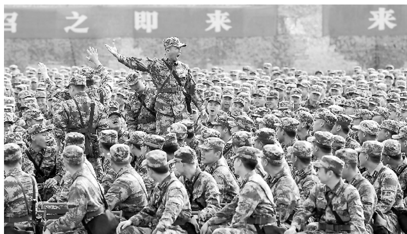
高唱军歌声势壮,拉歌增进战友情。