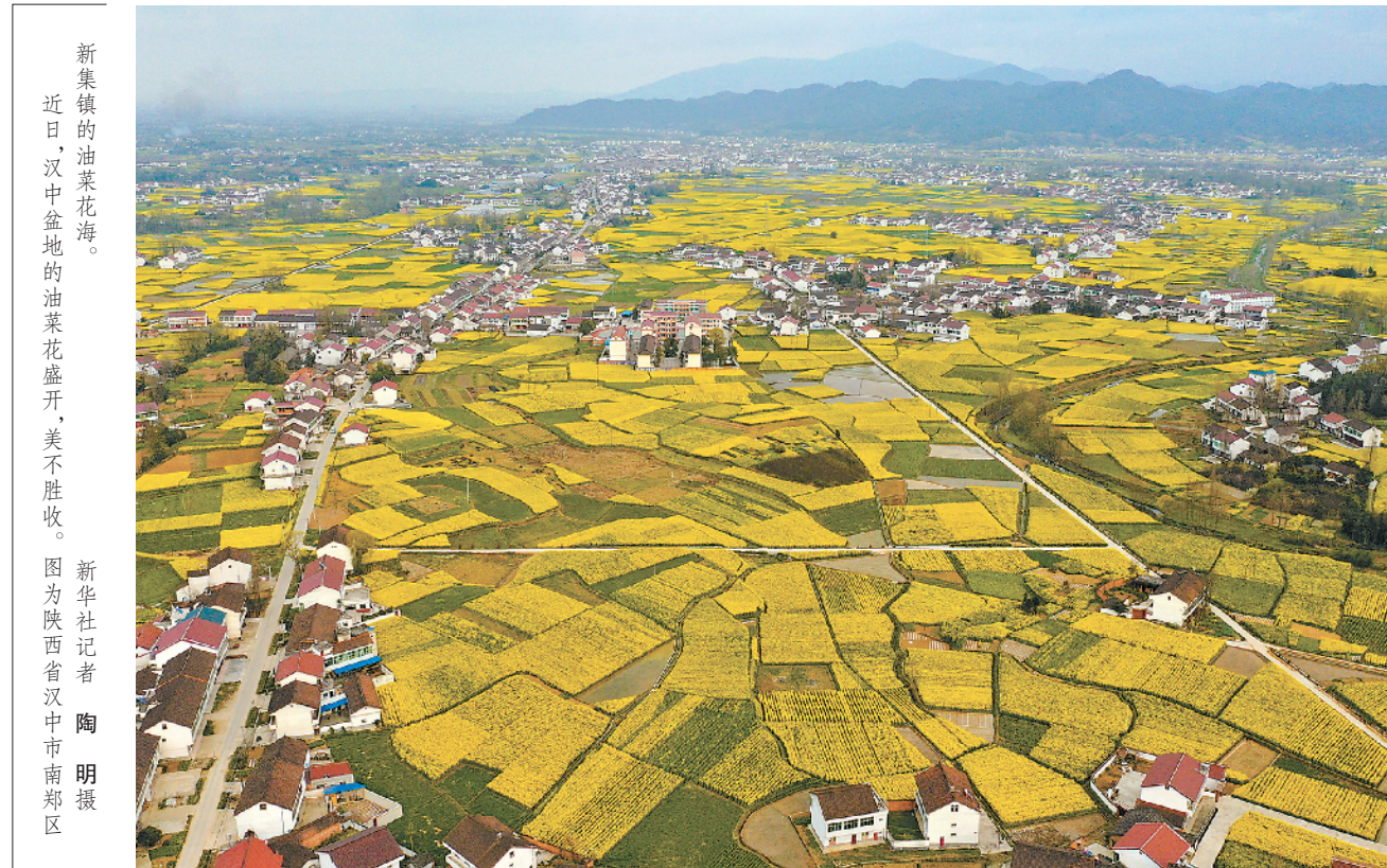
新集镇的油菜花盛开，美不胜收。近日，汉中盆地的油菜花盛开，美不胜收。图：陕西省汉中市南郑区 新华社记者 陶明摄

的特殊性，也提出了改进和调整的建议。国务院要求相关部门认真研究，并在一定范围内征求意见，在此基础上，决定调整2019年劳动节放假安排，通过调休形成4天假期。 国家发展改革委有关负责人说，劳动节适逢春夏之交，气候宜人，很多民众都希望春暖花开的时候外出旅游、探亲、休闲。为了回应人民群众的呼声，作出这样的调整，充分体现出以人民为中心的发展思想，顺应了社情民意，有利于更好满足人民群众多元化多样化的需求，进一步提升人民群众的获得感、幸福感和获得感。