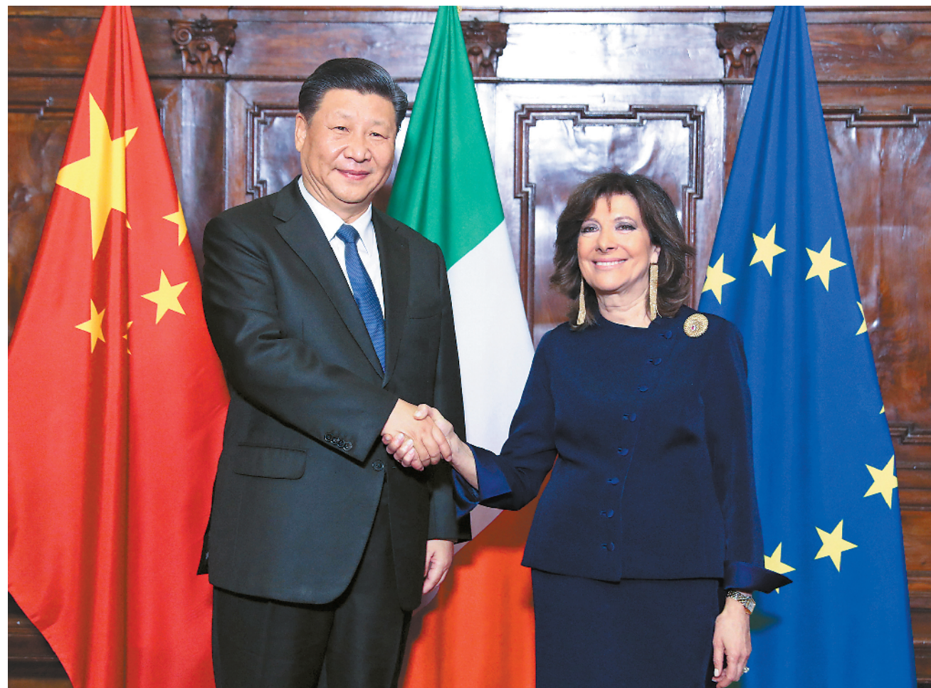
3月22日，国家主席习近平在罗马会见意大利参议长卡塞拉蒂。