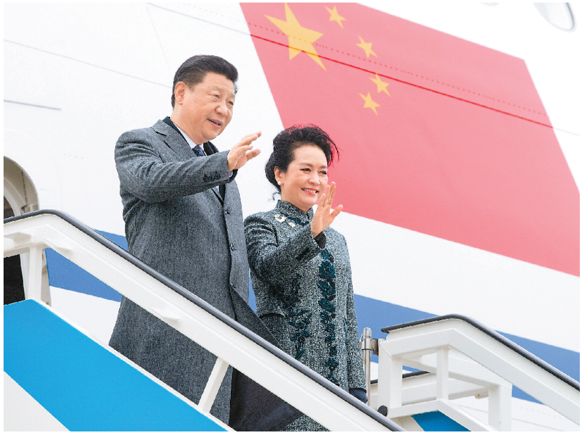
当地时间十二月四日,国家主席习近平抵达里斯本,开始对葡萄牙共和国进行国事访问。这是习近平和夫人彭丽媛步出舱门。

新华社里斯本12月4日电 (记者章亚东、李建敏)当地时间12月4日,国家主席习近平抵达里斯本,开始对葡萄牙共和国进行国事访问。 当习近平乘坐的专机进入葡萄牙领空时,2架葡萄牙空军战机升空护航。当地时间上午9时20分许,专机抵达里斯本国际机场。习近平和夫人彭丽媛步出舱门,葡萄牙外长席尔瓦等政府高级官员在舷梯旁热情迎接。礼兵分列红地毯两侧。习近平代表中国政府和中国人民,向葡萄牙政府和人民致以诚挚问候和良好祝愿。 习近平指出,中葡是传统友好国家。中葡关系从历史中走来,经受住时间和国际风云变幻的考验,历久弥新、历久弥坚。中葡关系从互信中走来。1999年,两国通过友好协商妥善解决澳门问题,树立了国与国解决历史遗留问题的典范。中葡关系从合作中走来。2005年,两国建立全面战略合作伙伴关系,互利合作进入快速发展轨道,给两国人民带来了实实在在的益处。 习近平强调,明年是中葡建交40周年,这是双边关系发展新的历史起点。