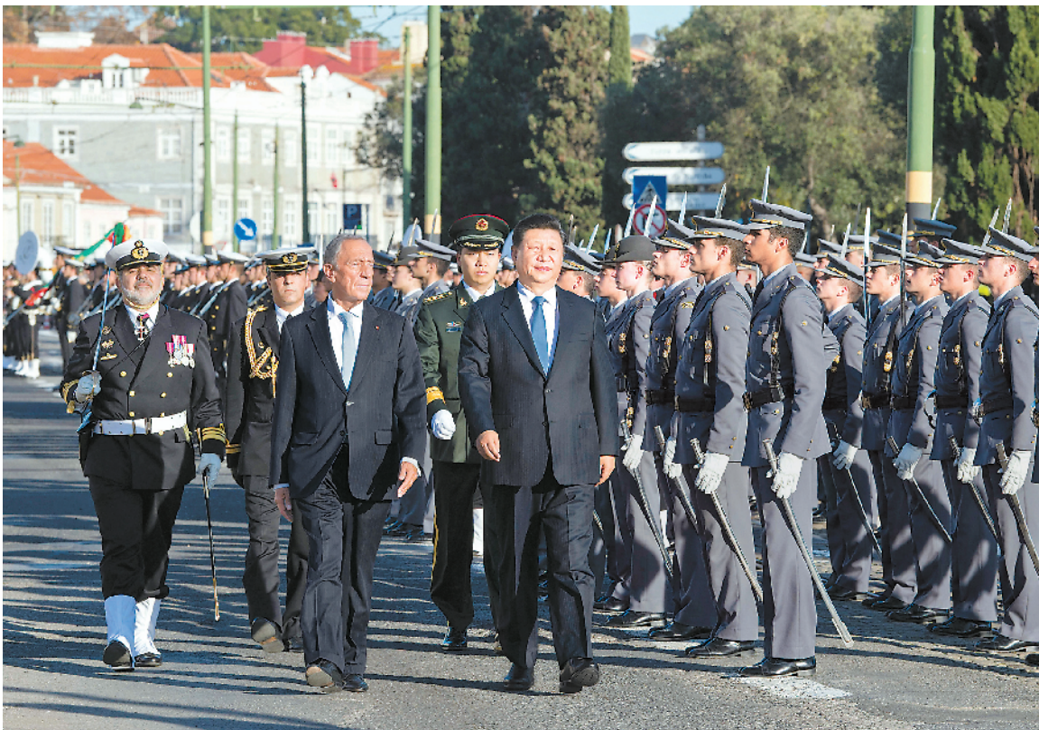
当地时间十二月四日,国家主席习近平在里斯本同葡萄牙总统德索萨举行会谈。会谈前,德索萨总统在帝国广场为习近平举行隆重欢迎仪式。

新华社里斯本12月4日电 (记者翟伟、孙奕、魏建华)当地时间12月4日,国家主席习近平同葡萄牙总统德索萨举行会谈。两国元首一致同意,以中葡建交40周年为新的历史起点,推动中葡友好合作不断取得新成果,谱写中葡关系发展的新篇章。 习近平指出,中葡友好交往源远流长,两国建交39年来,始终相互理解、相互尊重、彼此信任、互利合作,双边关系历经国际风云变幻考验,一直健康稳定发展。中国古人说:交得其道,千里同好,固于胶漆,坚于金石。中葡就是这样的好朋友、好伙伴。中方赞赏葡方坚持一个中国政策,愿同葡方在涉及彼此核心利益和重大关切问题上继续相互理解和支持。双方要密切高层交往,加强两国政府、立法机构、政党、地方、民间交流,深化政治互信,筑牢两国友好政治根基。双方要以签署中葡政府间共建“一带一路”合作谅解备忘录为契机,全面加强“一带一路”框架内合作,促进互联互通。双方要扩大务实合作,做大做强现