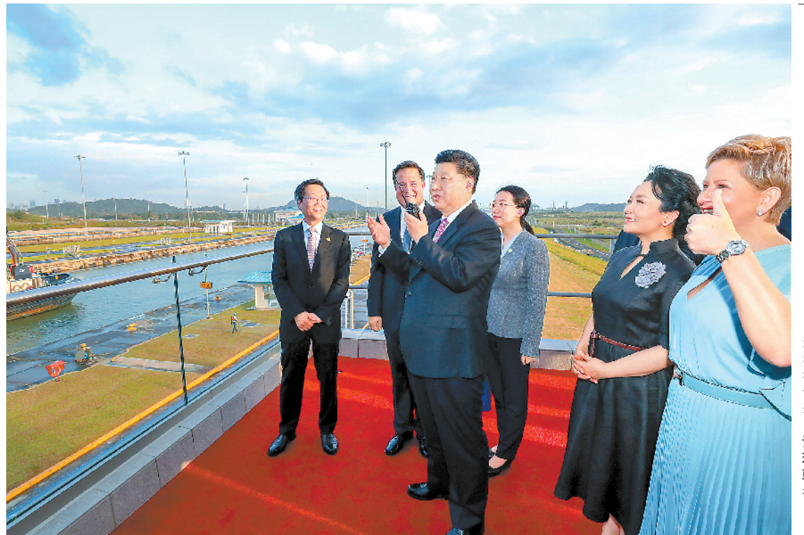
当地时间十二月三日,国家主席习近平在巴拿马城同巴拿马总统巴雷拉共同参观巴拿马运河新船闸。习近平和夫人彭丽媛抵达新船闸时,巴雷拉总统和夫人卡斯蒂略在停车场迎接。这是习近平同正在第一船闸停靠等待过闸的中国远洋海运集团“玫瑰轮”船长通话。