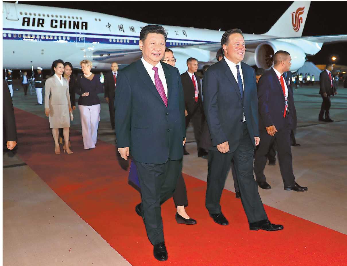
当地时间12月2日,国家主席习近平抵达巴拿马城,开始对巴拿马共和国进行国事访问。巴拿马总统巴雷拉和夫人卡斯蒂略在舷梯旁热情迎接习近平和夫人彭丽媛。