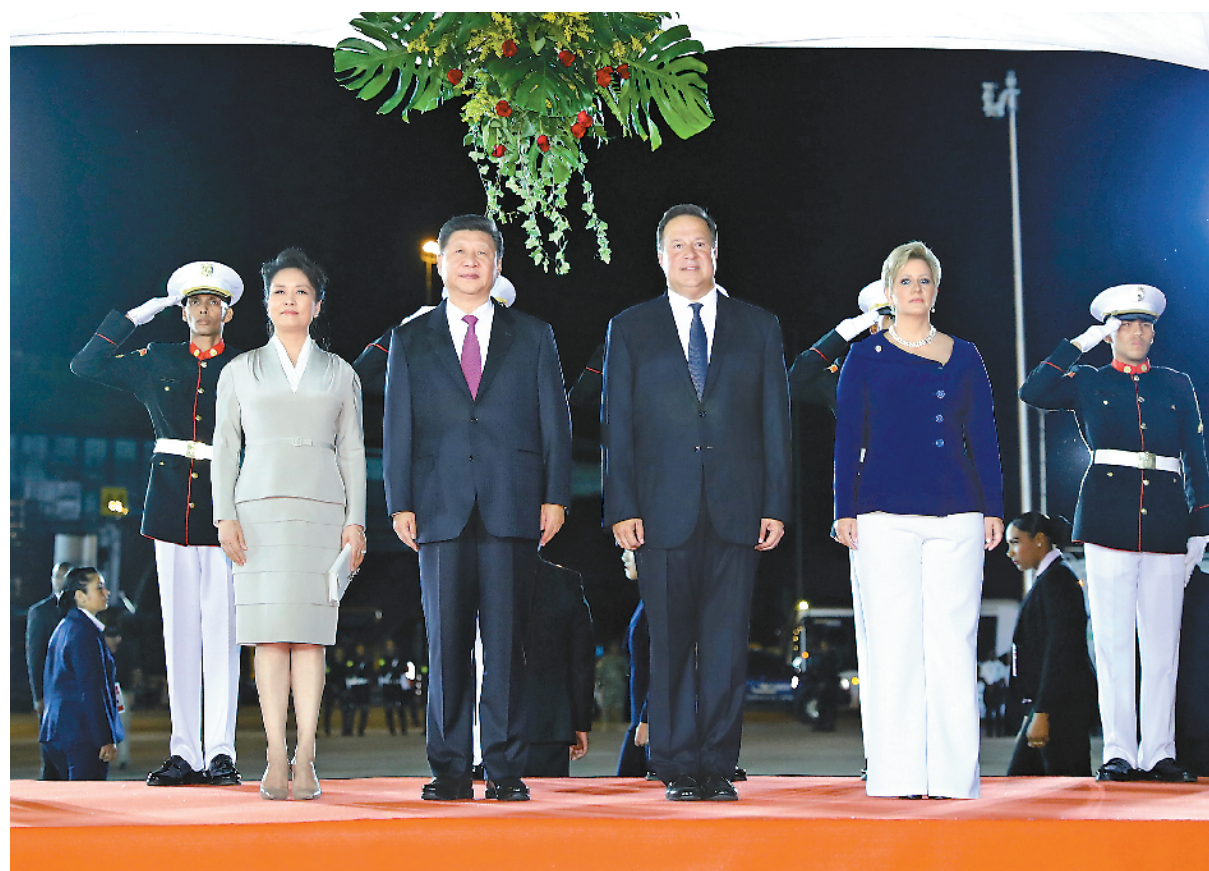
当地时间12月2日,国家主席习近平抵达巴拿马城,开始对巴拿马共和国进行国事访问。巴拿马总统巴雷拉在机场为习近平举行隆重欢迎仪式。这是习近平和夫人彭丽媛同巴雷拉和夫人卡斯蒂略在欢迎仪式上。

重点项目,推进互联互通。中方是巴拿马运河第二大用户。双方可以进一步优化货物集运方式,使巴拿马运河在中国更深度参与全球贸易中发挥更大效益。中方愿在相互尊重、平等互利基础上同巴拿马开展自由贸易谈判,欢迎巴拿马海产品、肉类、菠萝等对华出口,鼓励更多中国金融机构在巴拿马设立机构,包括人民币清算中心。要加强人文和地方等领域交流,便利双方人员往来,夯实两国关系民意基础。要加强在国际事务中的沟通,深化在联合国、世界贸易组织、中拉论坛等多边机制中的协调和配合,共同应对保护主义、单边主义等挑战,共同推动建设新型国际关系和开放型世界经济,更好维护发展中国家共同利益。 巴雷拉表示,热烈欢迎习近平主席对巴拿马进行历史性访问,此访必将进一步拉近巴中两国人民的友好感情。巴中建交以来,双边关系取得重大进展。很高兴我同习近平主席达成的共识得到很好落实,基础设施建设、人文等领域交流合作积极推进。巴方感谢中方对巴拿马经济社会发展提供的支持。巴拿马坚定奉行一个中国政策,赞同习近平主席提出的构建人类命运共同体等重要理念。巴方支持共建“一带一路”,期待同中方加强投资、港口运输、自贸区等领域合作,欢迎中国企业投资,愿同中方早日商签自贸协定,提升两国贸易水平。巴拿马希望利用自身区位和物流优势,成为连接中国与中美洲及拉美地区的门户和纽带。相信巴中合作不仅将造福两国人民,也将造福地区人民,为全球和平与繁荣作出贡献。 两国元首共同见证了多项双边合作文件的签署,还共同会见了记者。 丁薛祥、杨洁篪、王毅、何立峰等参加上述活动。