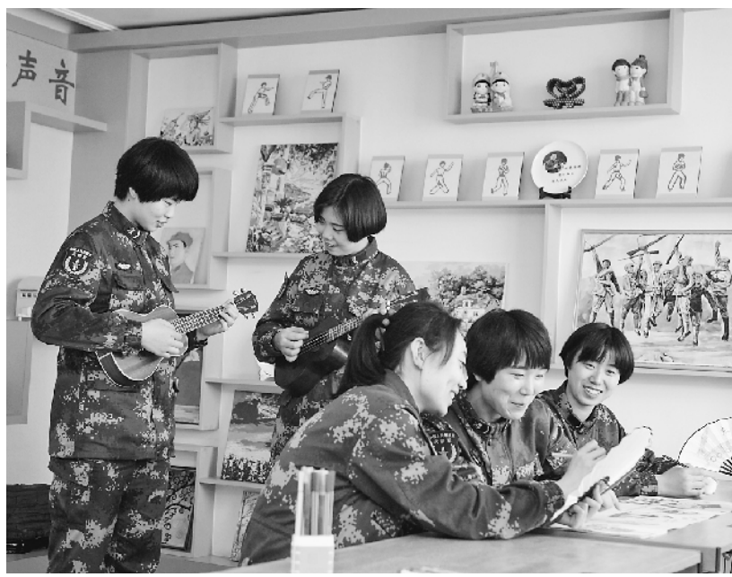
育才活动室里欢声笑语,女兵们正进行创作。